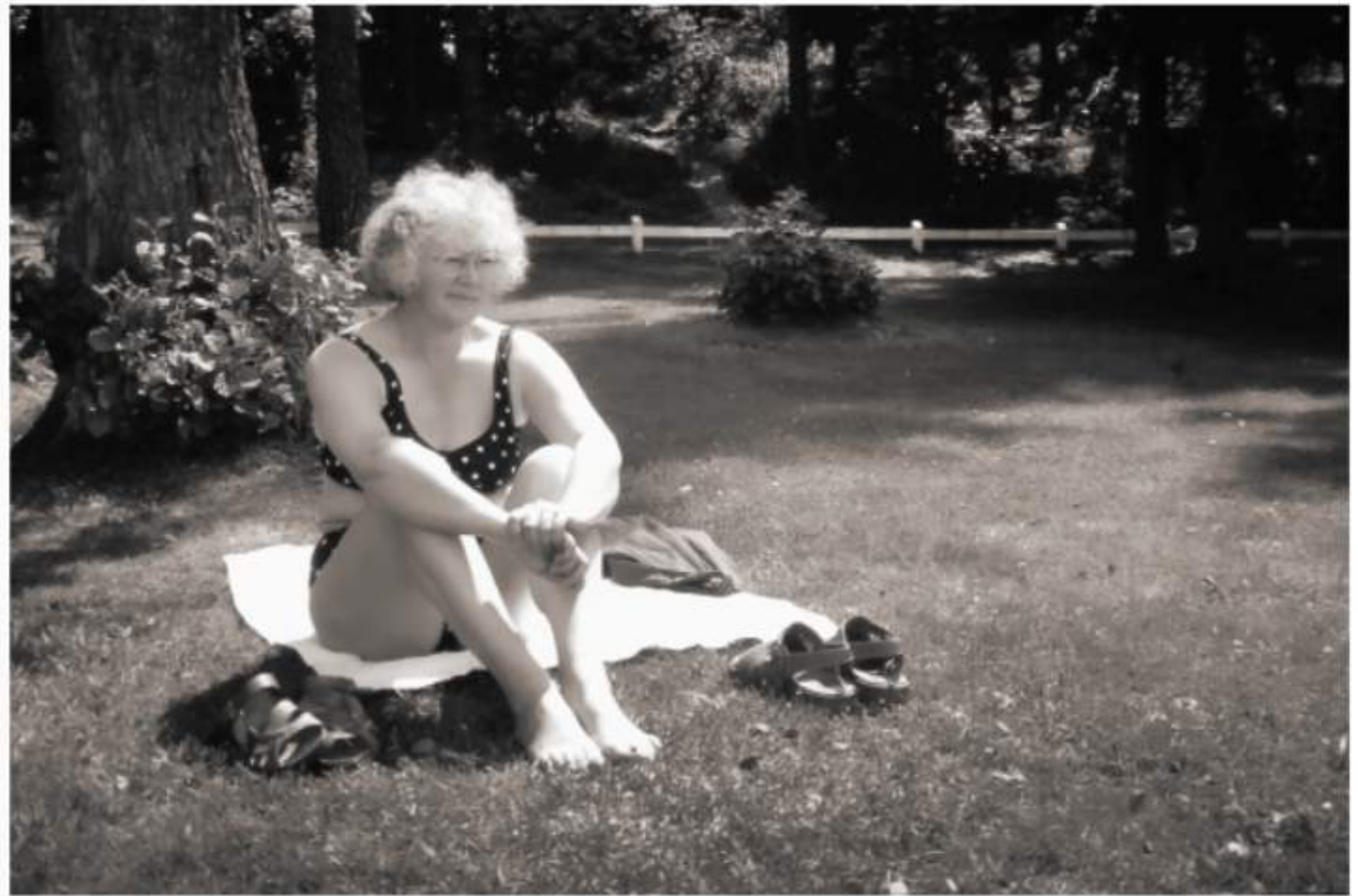
Jahrzehnte später an einem See in Schweden