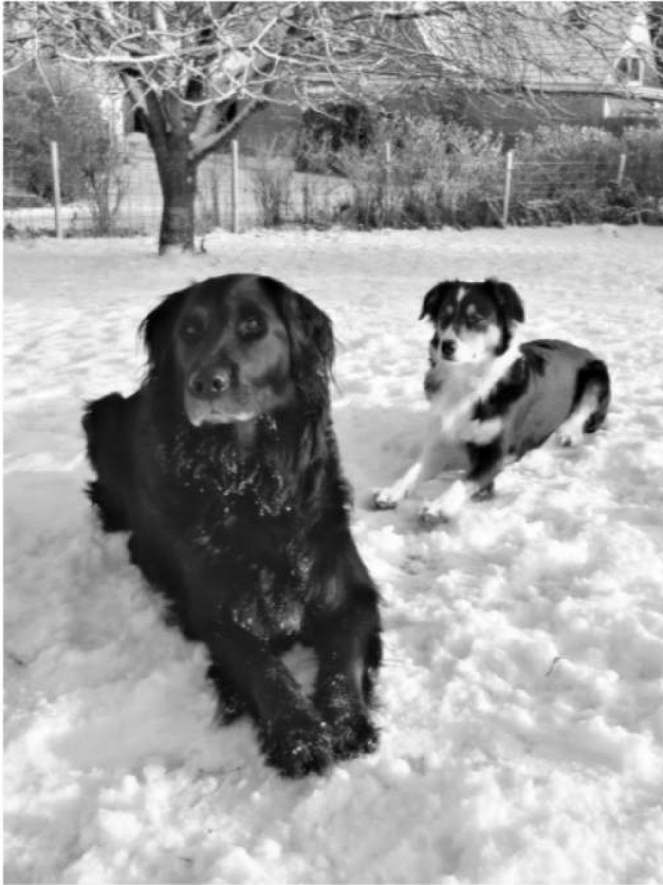
Kalla und Bine im Schnee