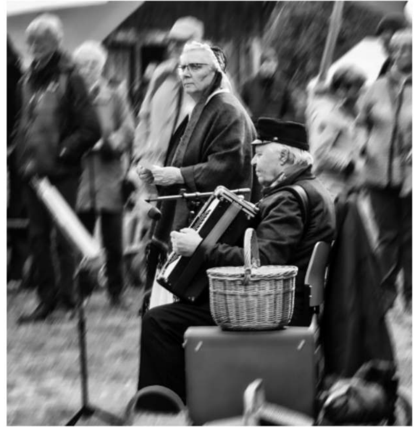
Musikus mit Muse