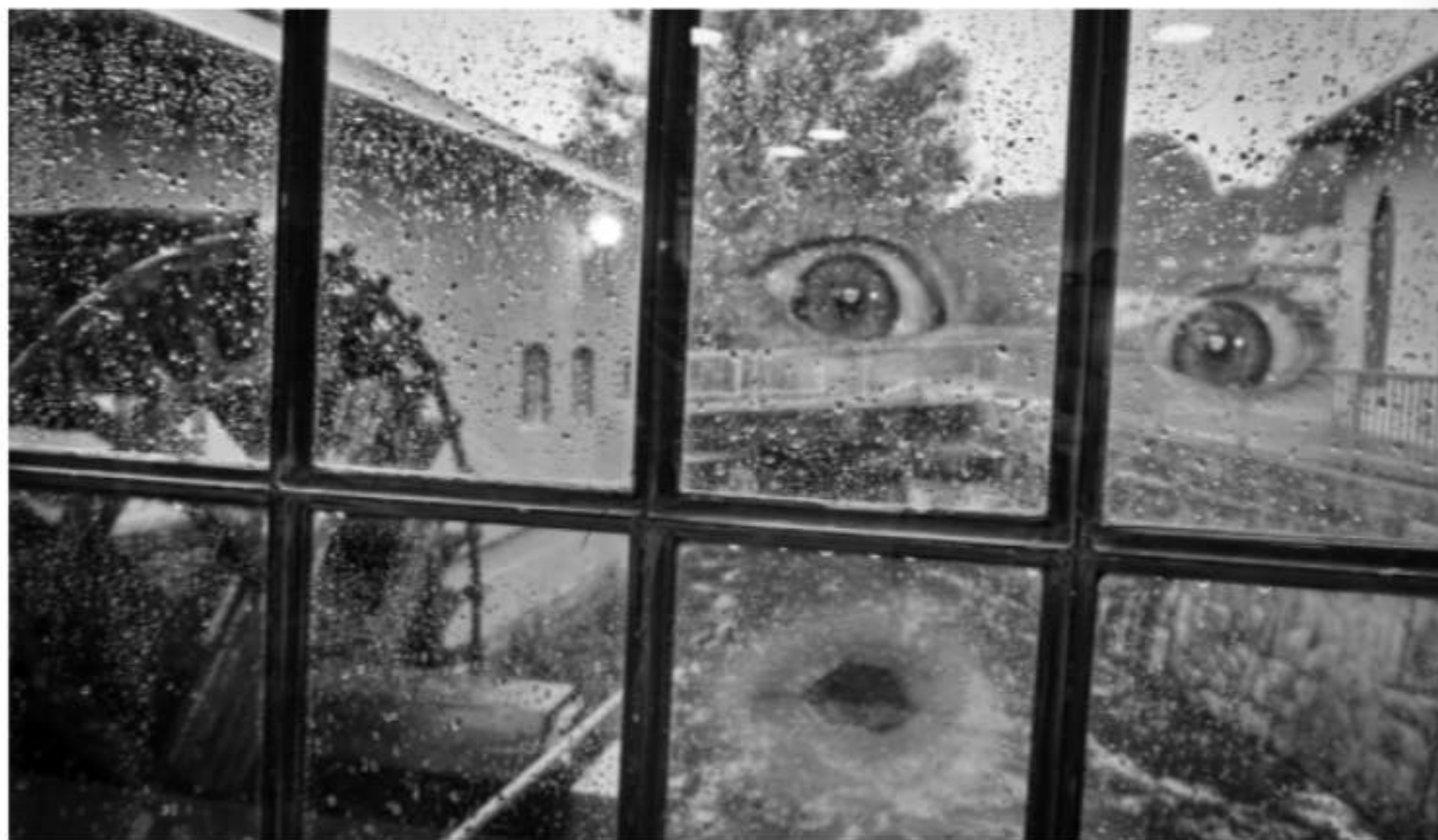
Wasserrad vom Hammerwerk