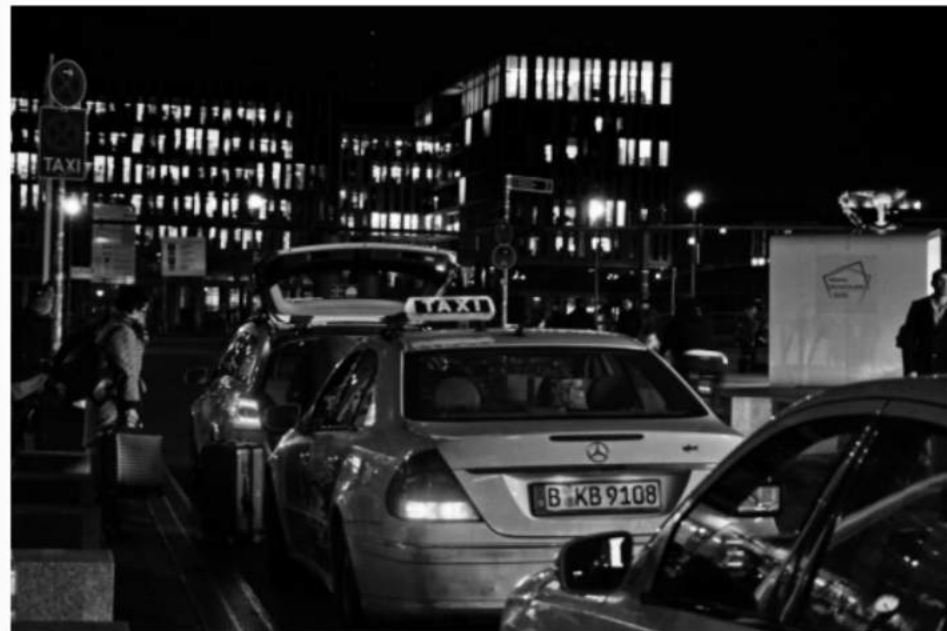
Hauptbahnhof Berlin, Taxistand