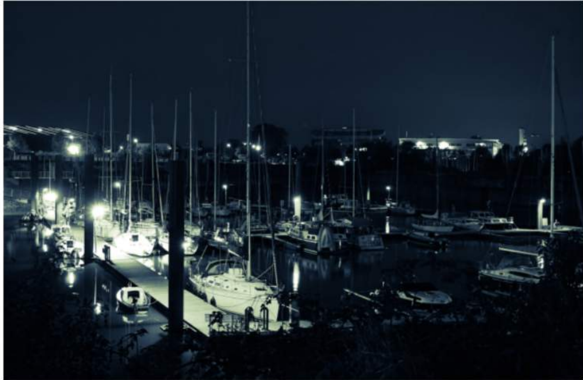
Schlafplatz für Boote