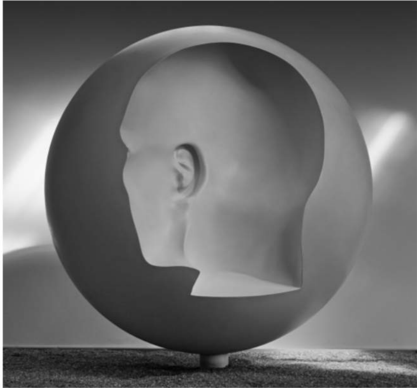
innen oder außen