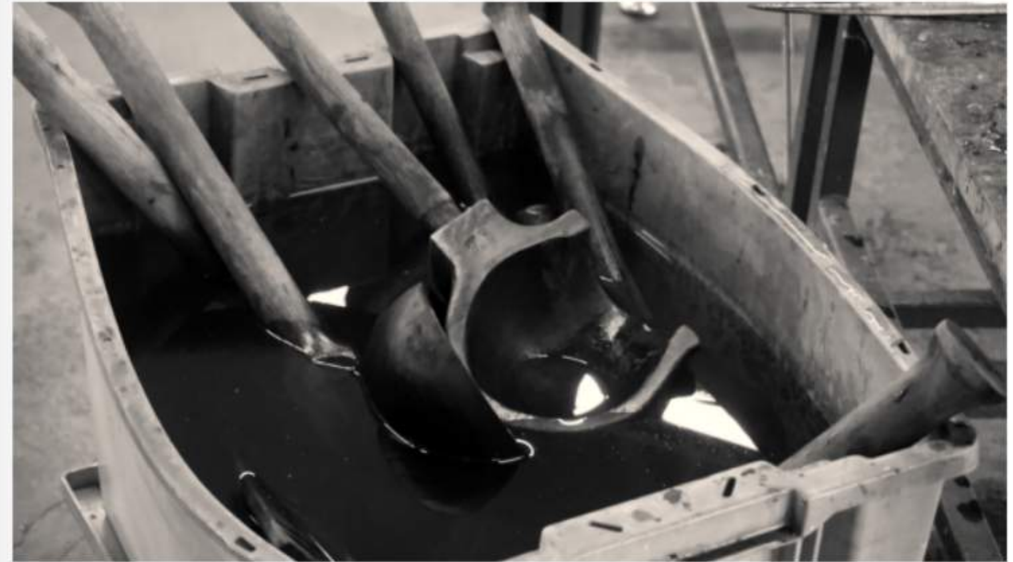
Werkzeug des Glasbläfers