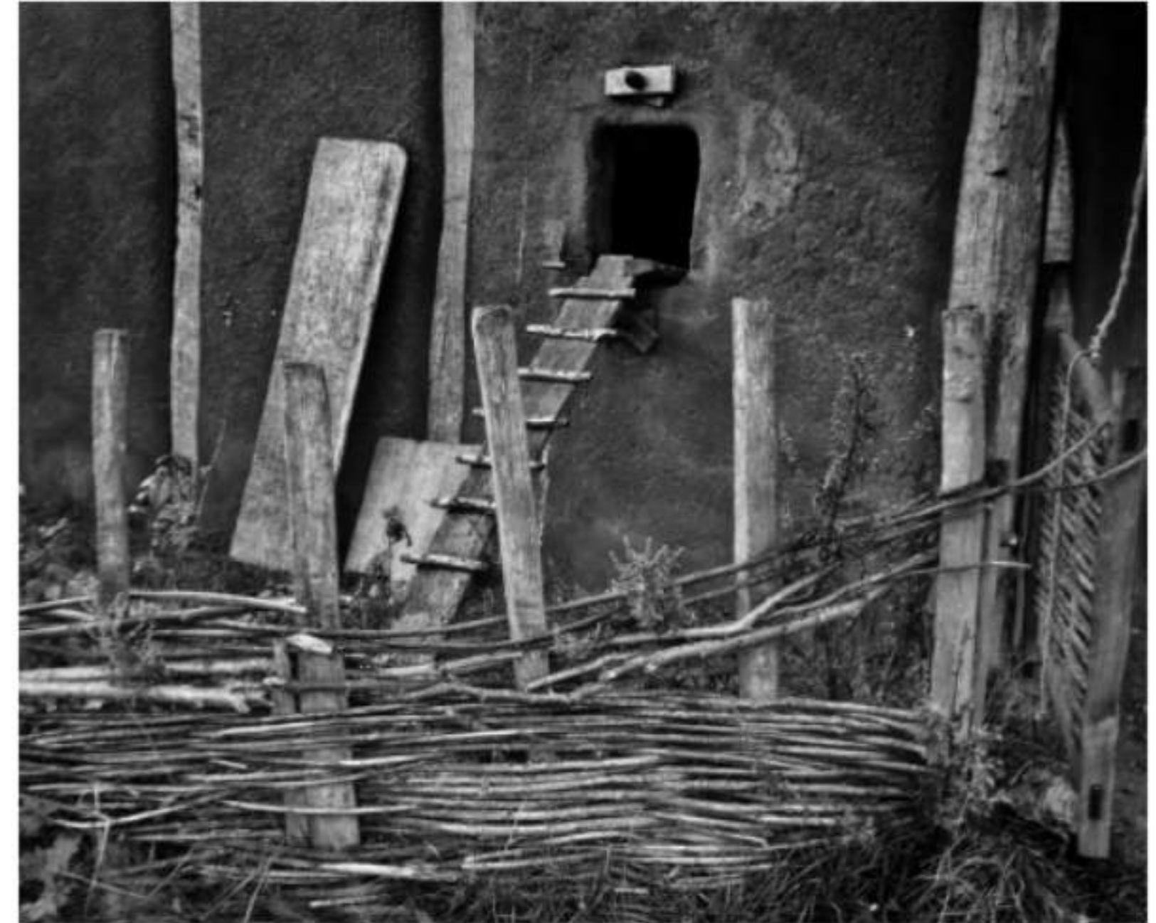
Schlafplatz für Hühner