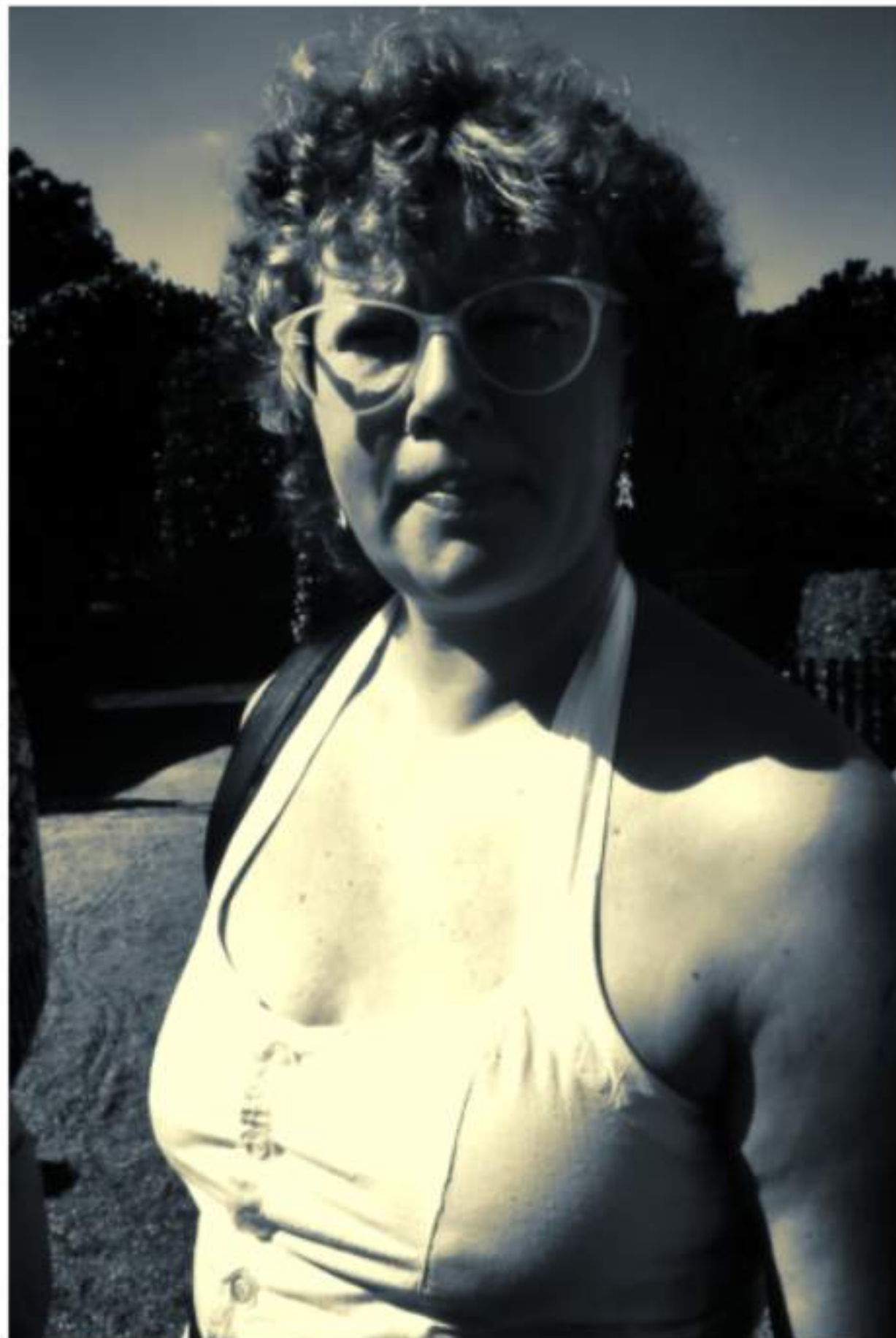
In den 80ern in Schweden