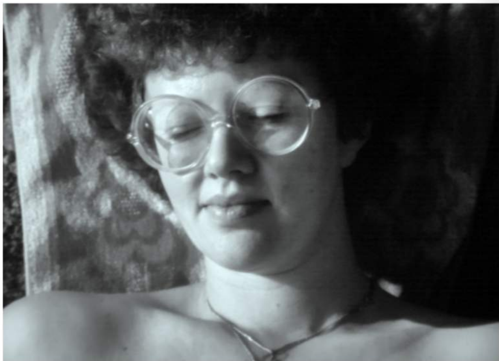
Sonnenbad am Mittelmeer