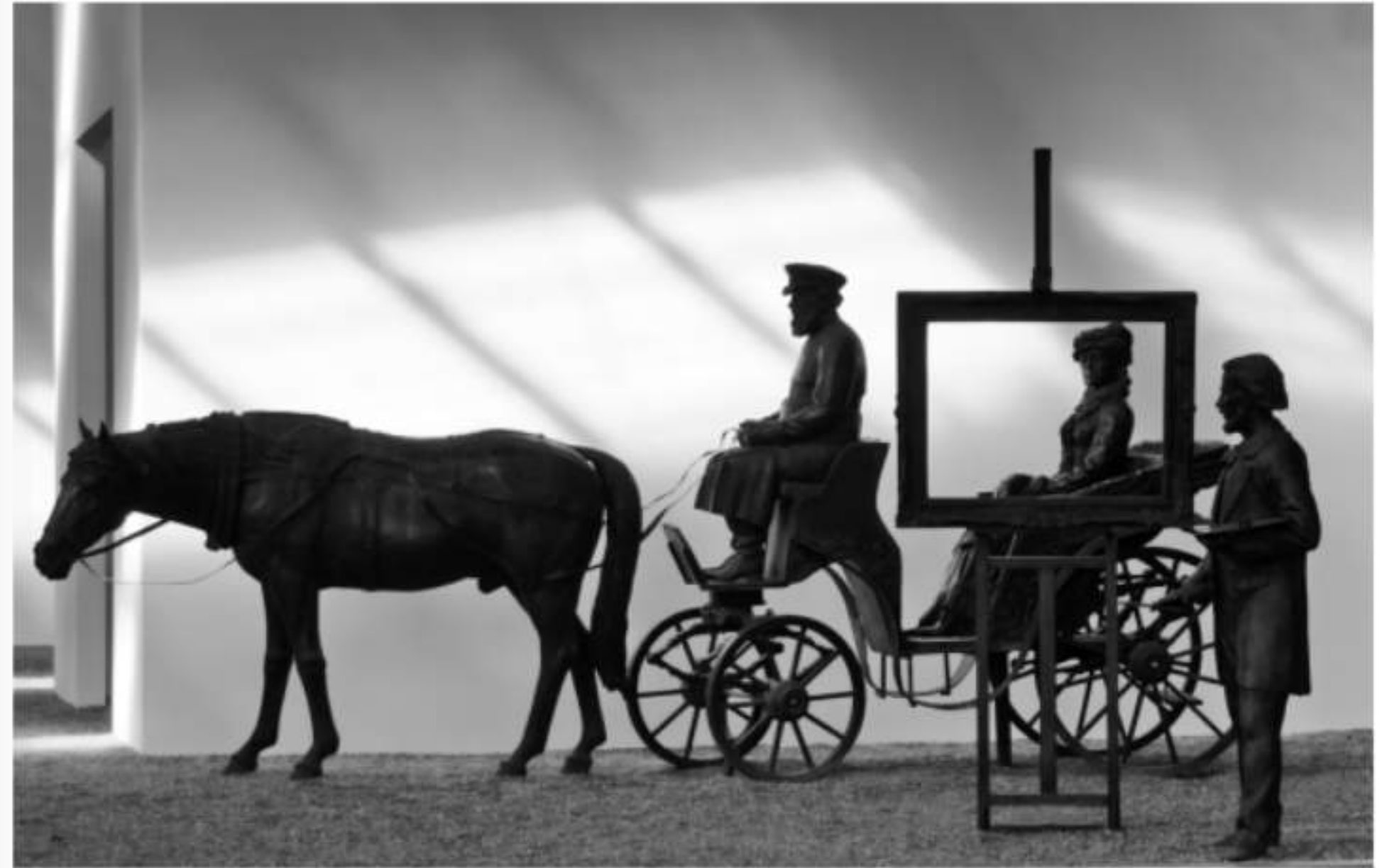
vor und hinter