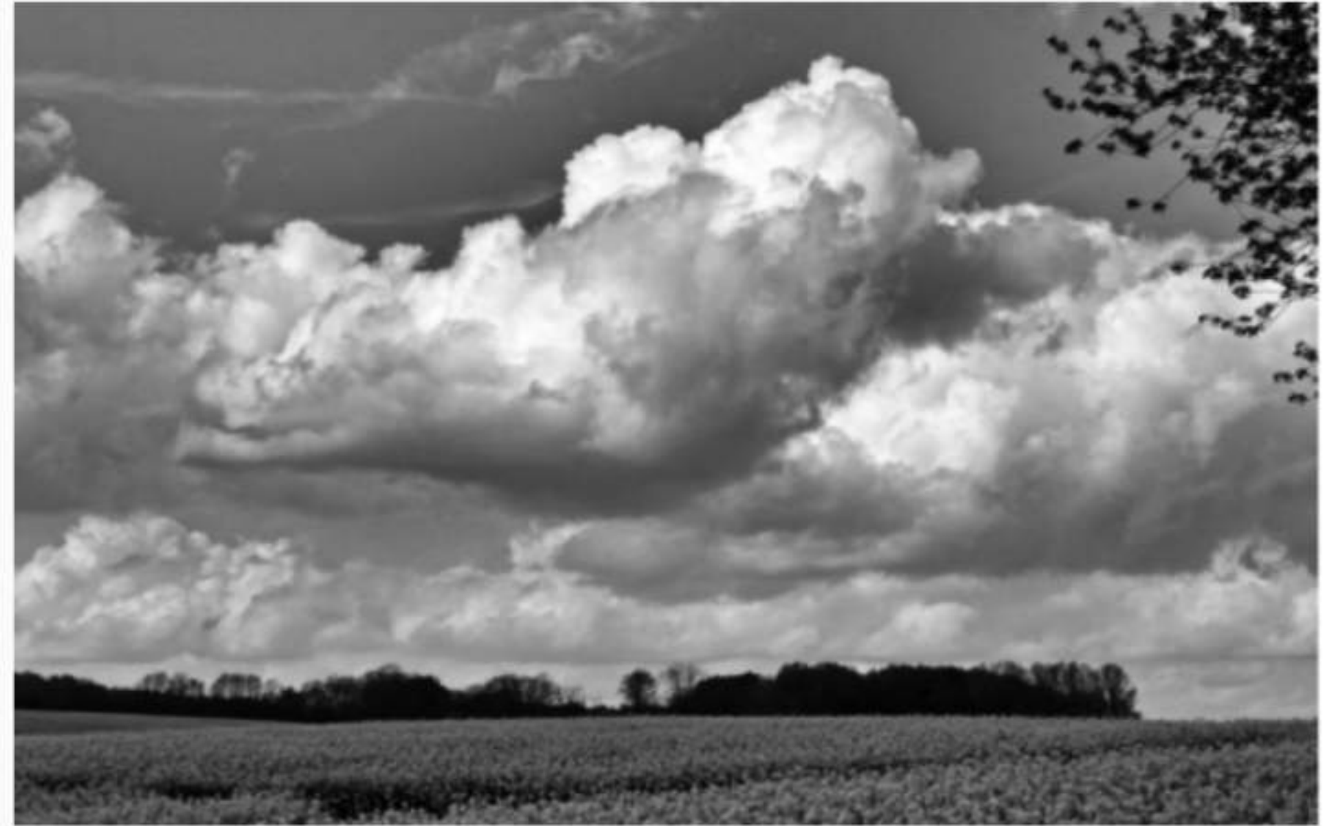
Wolken über Ohrfeld