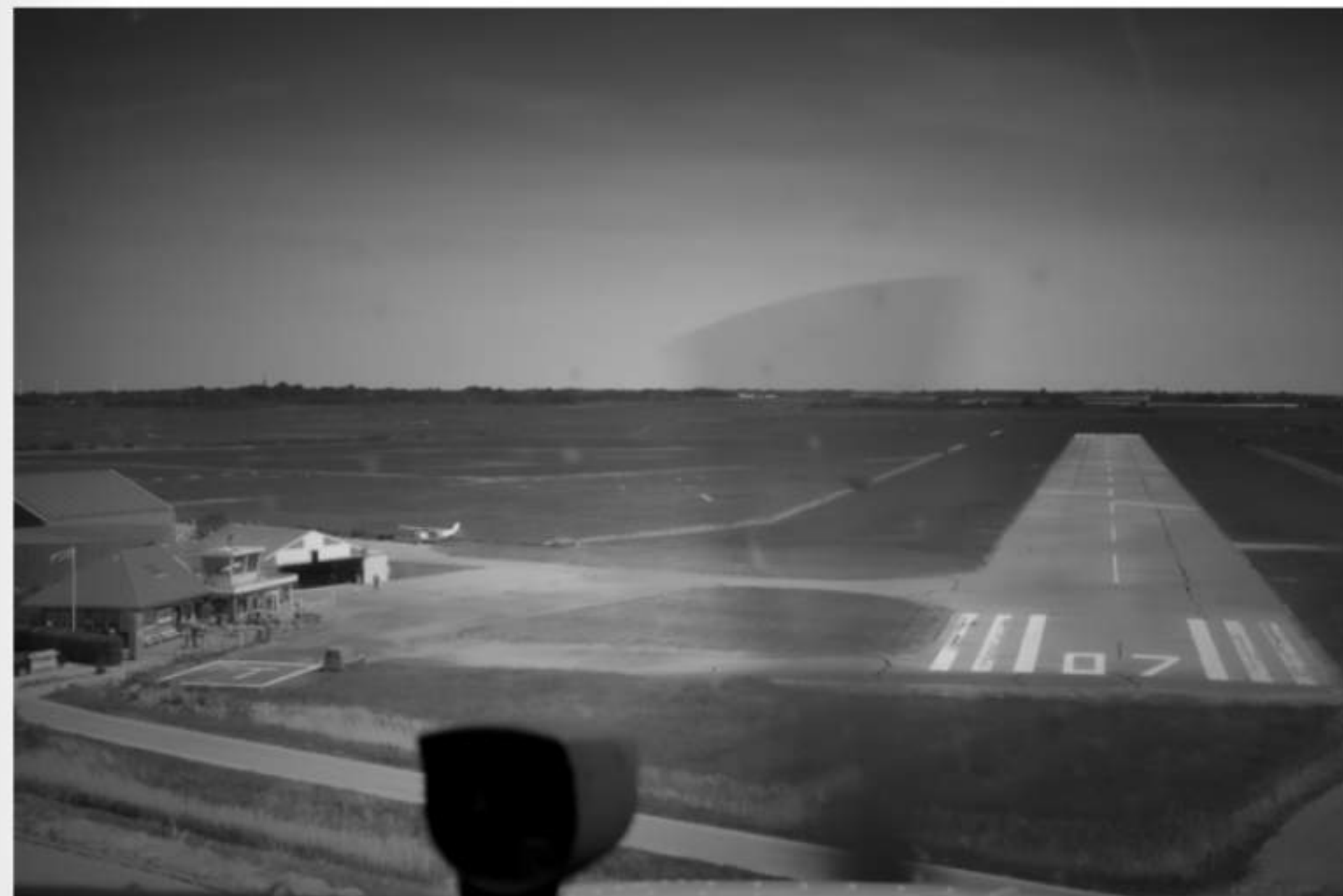
Anflug auf EDXO -RY 07