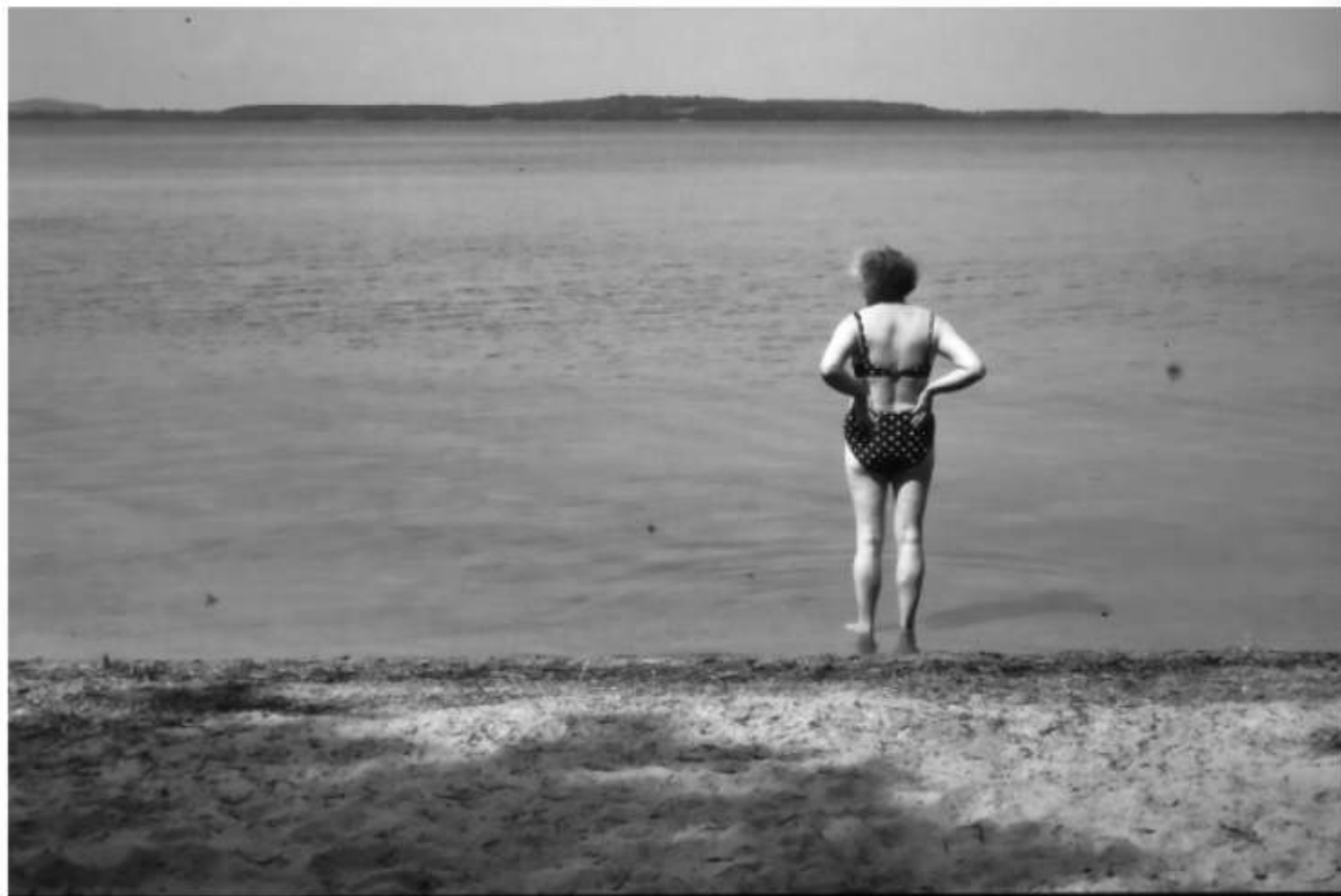
Sommer in Schweden