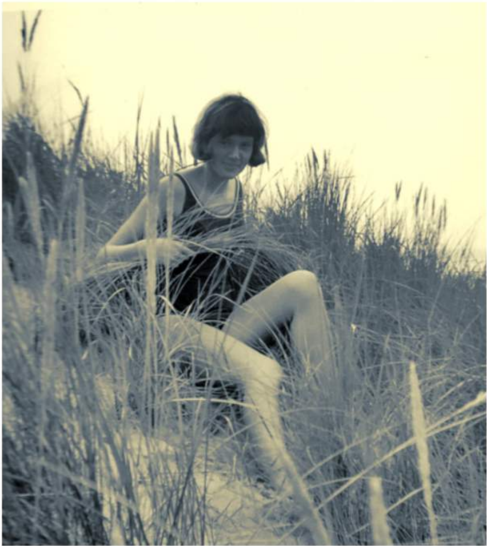
In den Dünen