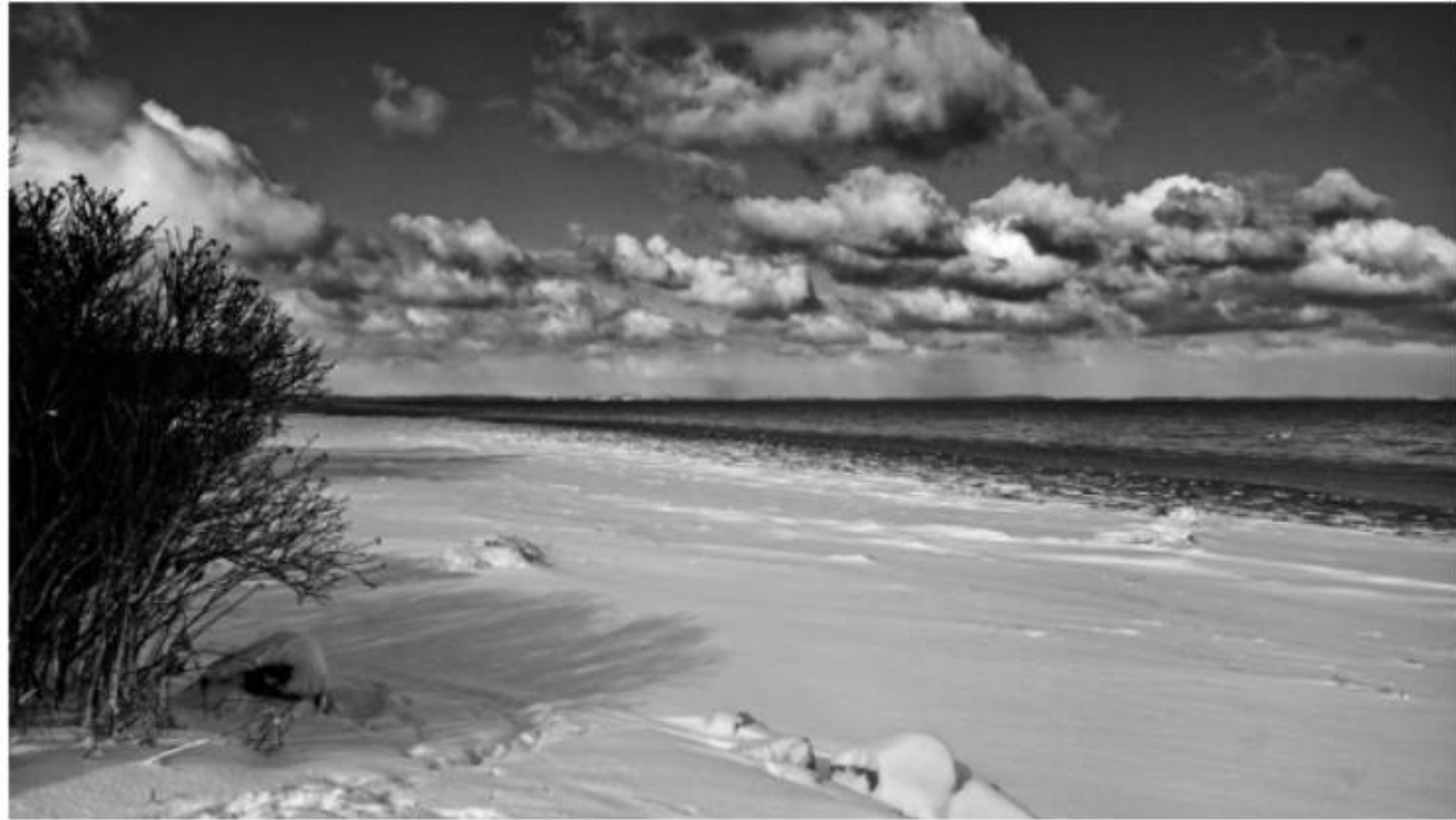
Winter an der Förde